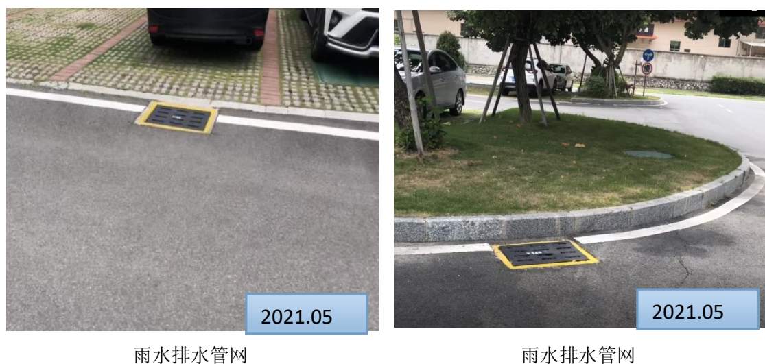
图 3-1 水土保持工程措施照片