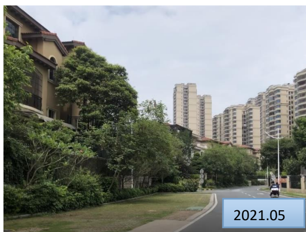
地块内乔灌草绿化