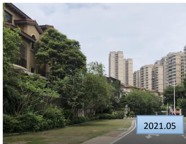
现状硬化道路及绿化