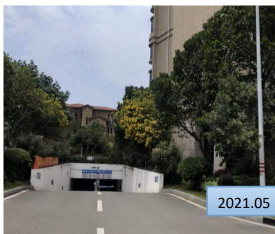
现状硬化道路及绿化