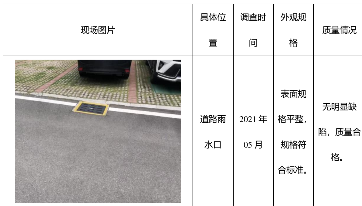
表 4-2 水土保持工程措施部分现场调查表

现场抽查工作的重点是排水工程等水土保持工程措施，检查其工程外观形状、轮廓尺寸及缺陷等。综合资料查阅和现场检查的结果，评估组认为：本工程建设过程中将水土保持工程措施纳入主体工程施工之中，水土保持建设与主体工程建设同步进行，质量保证体系完善。对进入工程实体的原材料和中间产品、成品进行抽样检查、试验，对不合格材料严禁使用，有效地保证了工程质量。水土保持工程措施从原材料、中间产品至成品质量合格，建筑物结构尺寸规则，外表整齐，质量符合设计和规范的要求，工程措施质量总体合格。水土保持工程措施部分现场调查见表 4-2。