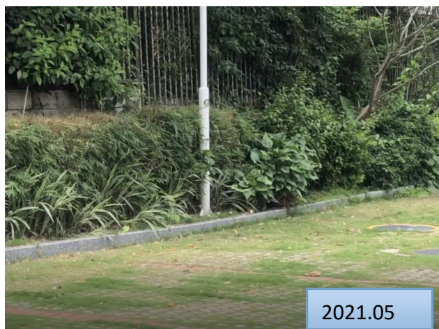
地块内乔灌草绿化