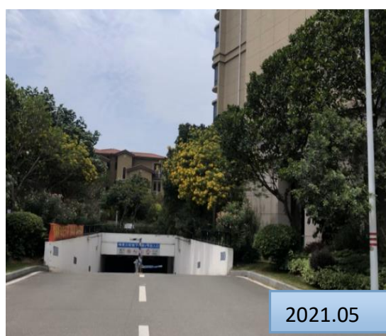
地块内乔灌草绿化