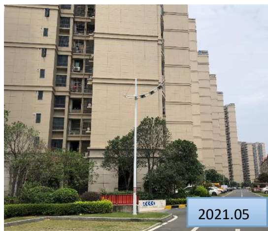
建筑物旁乔灌草绿化