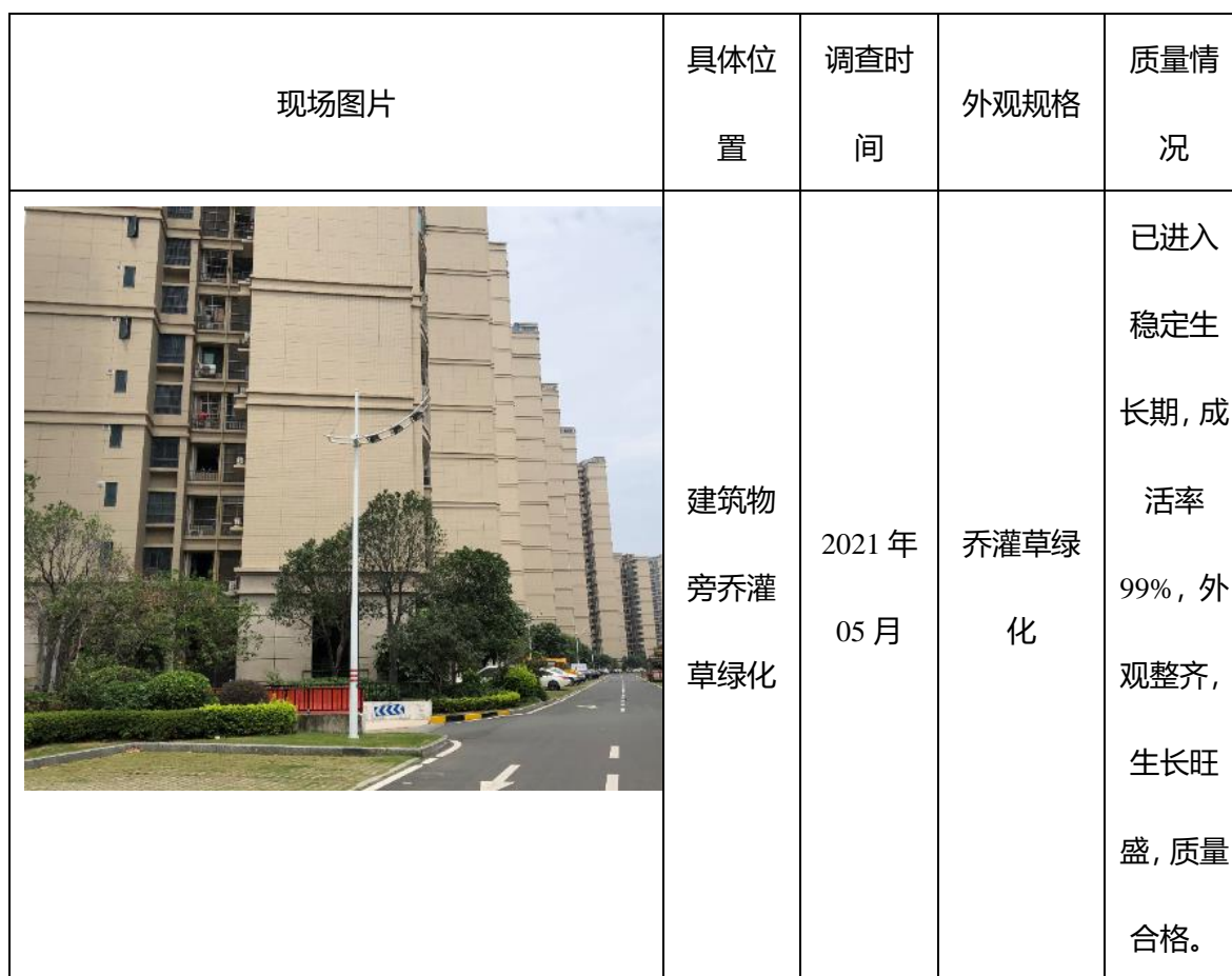
表 4-4 水土保持植物措施部分现场调查表

按照验收范围、验收内容，采用上述自验方法，对工程植物措施实施情况进行现场调查，建设区内植物措施面积基本采取了全查的核对方式。部分现场调查情况见表 4-4。