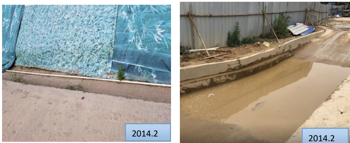
图 3-4 水土保持临时措施照片

通过对比，实施的工程量基坑排水沟、临时排水沟与方案设计基本一致。总体来说，本项目实施的临时措施基本满足临时防护的要求，有效地控制了水土流失的发生，根据调查和咨询，项目建设过程中没有对周边环境产生水土流失危害。水土保持临时措施照片见图 3-4。